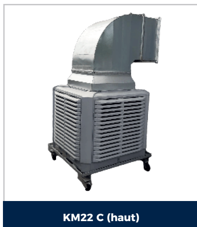
KM22 C (haut)

La gamme KM des rafraichisseurs d'air comporte 3 modèles de 22000 à 35000 m 3 /h qui vous permettront de rafraichir des locaux de grands volumes. Consommation en eau et électricité minime. Idéal pour l'industrie et l'événementiel en alternative à la climatisation industrielle.