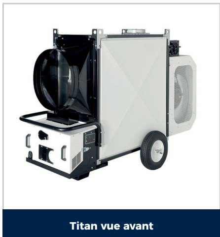
Titan vue avant