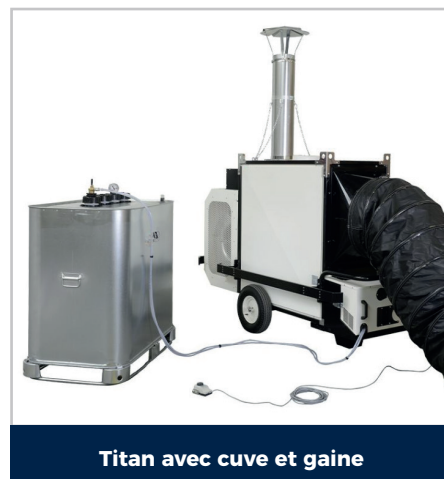
Titan avec cuve et gaine