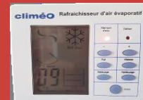
Panneau de commande électronique du KS18Y