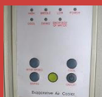
Panneau de commande et Affichage du JK90