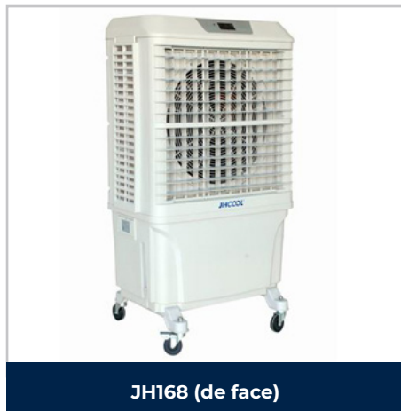
JH168 (de face)

Compacts et efficaces, les rafraichisseurs CLIMEO JH168 sont conçus pour les locaux de moyennes et grandes dimensions. Ils assurent une baisse de la température ambiante par l'action naturelle de l'eau et produisent un climat intérieur confortable en optimisant la température et l'hygrométrie.