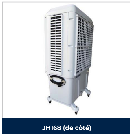
JH168 (de côté)