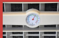
Hygostat indicatif sur face avant