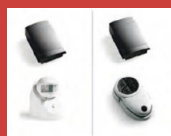
Détecteur de présence pour 2 HATHOR 2000 W Commande à distance pour 2 HATHOR 2000 W