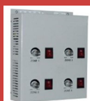
Variateur pour 4 HATHOR 2000 W