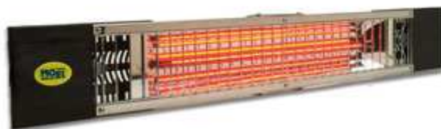
Modèle PETALO 728P